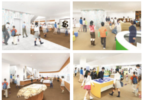
触って体験しながら学べる展示がいっぱいあります!