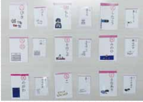
楽しみながら学べる漢字カルタ。当てはまる漢字を絵柄から想像。意味も考えながら取ることで学習できます。

駒ヶ根市内の小学校では、支援が必要な小学1年生の漢字学習教材として、「漢字カルタ」を使用しています。これは、駒ヶ根市教育委員会が2014年から取り組んでいる文