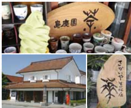
喜多方 蔵の里

「喜多方ラーメン」で知られる福島県喜多方市。江戸時代には酒造が栄え、その技術を活用して味噌や醤油の醸造業が行われるようになり、醸